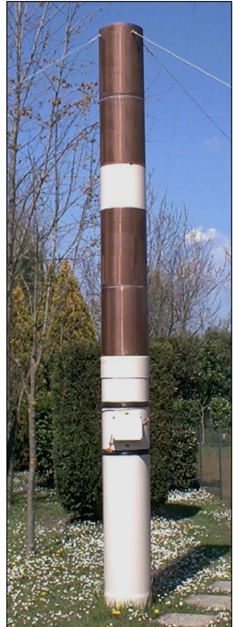
ANTENNA EH-160 FINITA